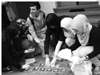
Gemeinschaftliche Putzaktion von JUGA www.juga-projekt.de