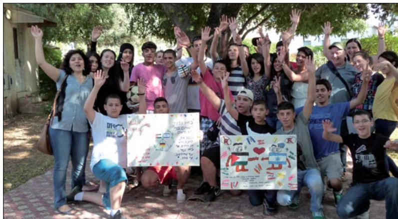
So kommen wir uns näher: Begegnungsseminar mit Schülern aus Israel und aus unserer Schule in Givat Haviva/Israel

Im Sinn des Freiwilligendienstes ist als Unterkunft natürlich eine Wohngemeinschaft bestens geeignet. Aber auch andere Möglichkeiten sind denkbar. Für die Gasteltern wird es sicher eine interessante und bereichernde Erfahrung, einen Freiwilligen für ein Jahr bei sich zu haben.